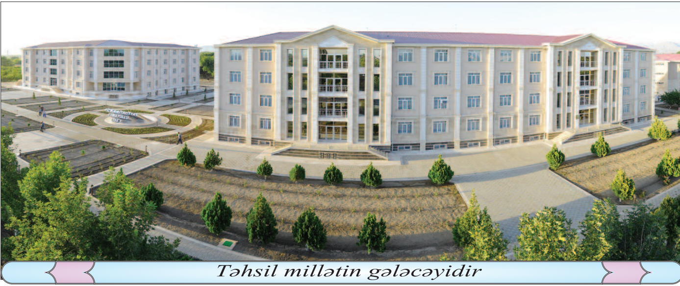
Təhsil millətin gələcəyidir